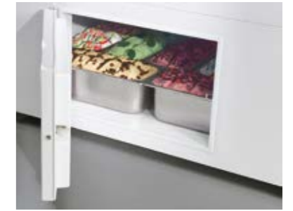
Storage cell Cella di riserva